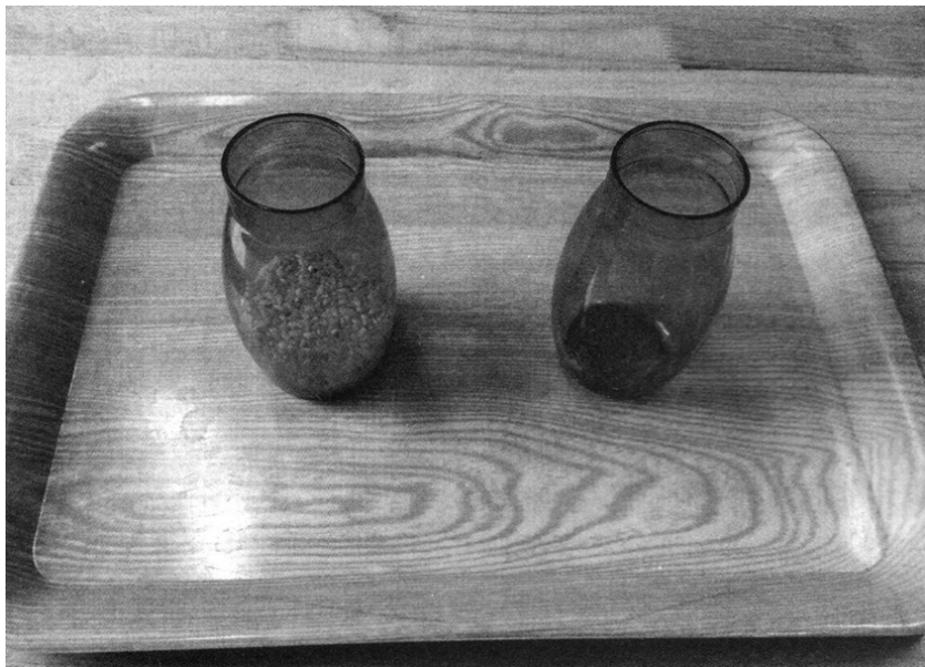
图 2-2 玻璃杯倒米

(2)在日常生活中,儿童可以根据具体情节进行活动。例如,娃娃家的活动。儿童可以到娃娃家做客,倒水来招待客人,可以将水从大的容器倒入杯子中。当然,这项活动需要在一定练习的基础上进行。