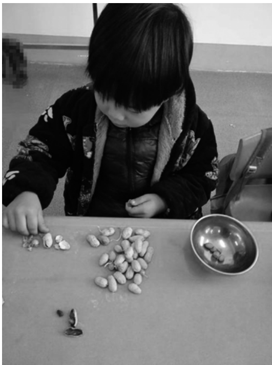
图 2-6 剥花生