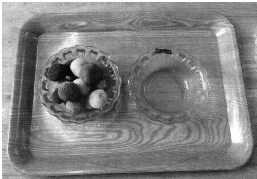
图 2-1 大把抓