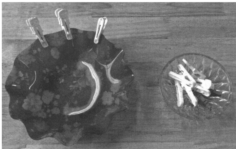
图 2-5 夹子

活动准备: 各种夹子 10 个、小盘 1 个、纸片若干。夹子如图 2-5 所示。